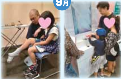
メディメッセージ