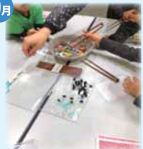
沼津ふくしまつり