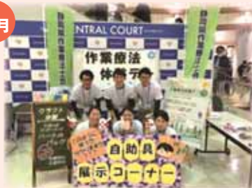
作業療法体験デー