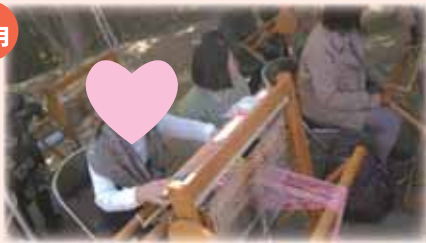
フラワーパーク花フェスタ さをり織り体験