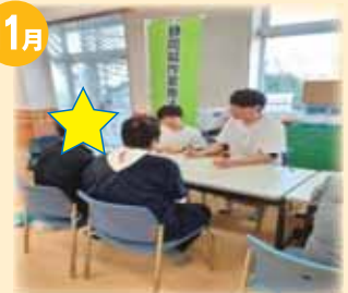
城東町交流まつり