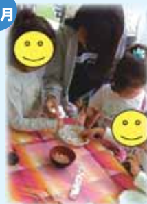
御前崎ふれあい広場