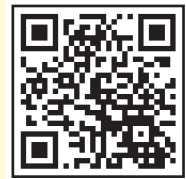
参加申し込み用 2次元コード

電話 03-5728-6633 (平日 午前10時~午後5時) メール event5@npwo.or.jp ※件名に「長寿の未来フォーラム」と入れてお問い合わせください。