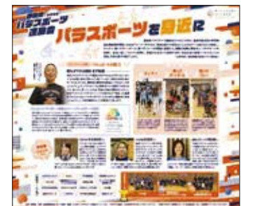
メディア広告 (令和5年11月18日静岡新聞掲載)