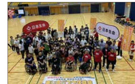
車いすバスケットボール体験会 (日本生命保険相互会社)