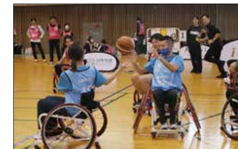
静岡県パラスポーツ運動会(静岡県)